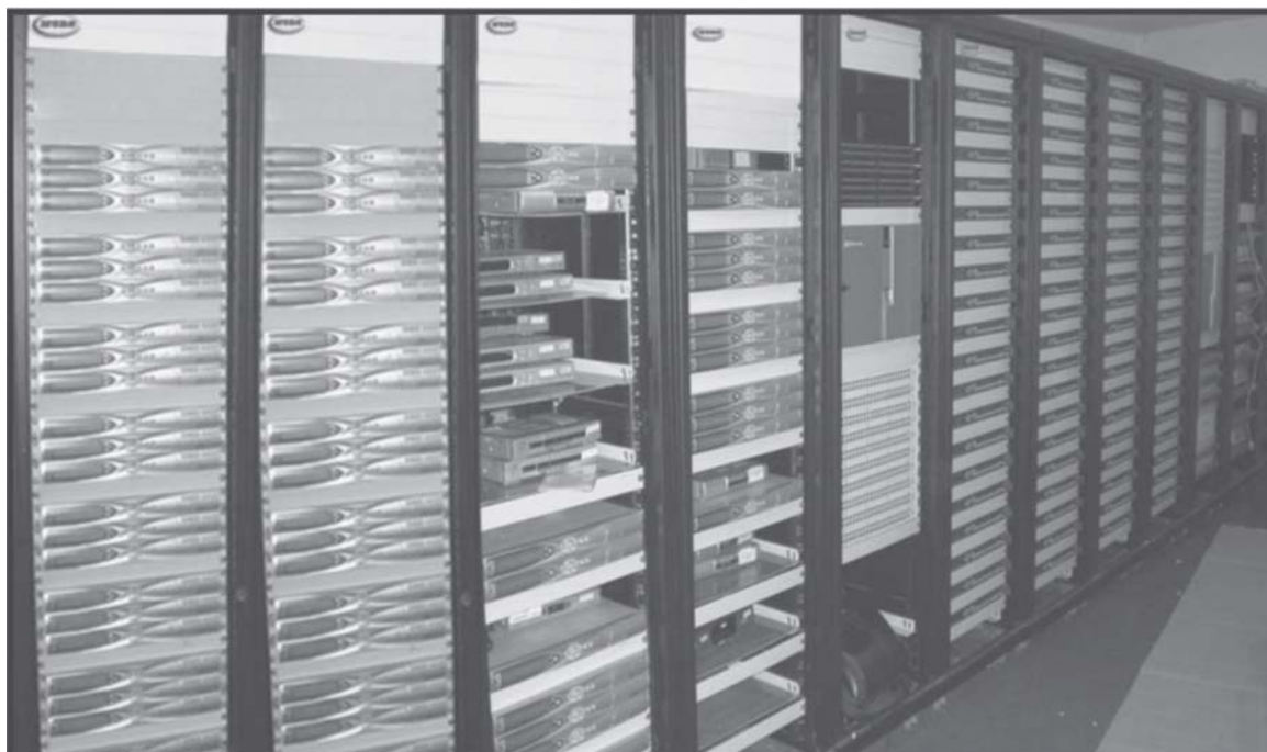
The Master Headend Installed At Thanjavur/Coimbatore/Tirunelveli तंजावूर/कोयंबतूर/तिरुनेल्वेल्ली में लगाये गये मास्टर हेडएंड