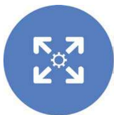
End to End Solution

ऐप्स आज किसी भी सेवा का चेहरा है और थोड़ी विशिष्टता का निर्माण कुछ ऐसा है जो रिवरसिलिका ओटीटी प्रवासन की आपकी खोज में आपकी मदद कर सकता है। यह आपको ग्राहक के रूप में एक महान विभेदक प्रदान करता है जबकि आप अपने अंतिम ग्राहक को सबसे अच्छे चैनल प्रदान करते हैं। यह सुनिश्चित करने के लिए कि ऐप्स प्रमाणित, अनुसमर्थित और सफलतापूर्वक लॉन्च किये गये हैं, रिवरसिलिका हर तरह से आपका समर्थन कर सकती है। रिवरसिलिका का PIXFIX™ प्ले टेम्प्लेट और कस्टम बिल्ड एप्लिकेशन इंफ्रास्ट्रक्चर इसे ओटीटी सेवाओं के तेजी से रोल आउट के लिए फायदेमंद बनाता है।